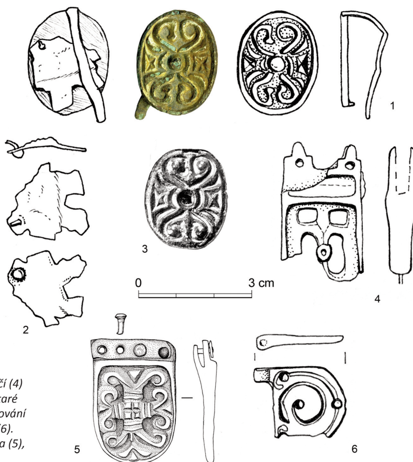
Obr. 2. Průvlečka (1, 2) a nákončí (4) z Kosiček a jejich analogie (3 Staré Město, hrob 114/51, 5 Bojná). Kování z Libčan, okr. Hradec Králové (6). Podle V. Hrubého (3) a V. Turčana (5), ostatní – kresba L. Raslová