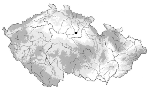
Obr. 1. Kosičky, okr. Hradec Králové, poloha nálezů. Kresba J. Minarčíková. Vlevo: poloha lokality na mapě ČR

2. Neúplné lité nákončí s prolamovanou liliovitou výzdobou s jedním uzlíčkem ve středu a dvěma výběžky pro nýty. Pod výběžky je malé obdélné vhloubené pole. Kování je vyrobeno vcelku. Obr. 2:4.